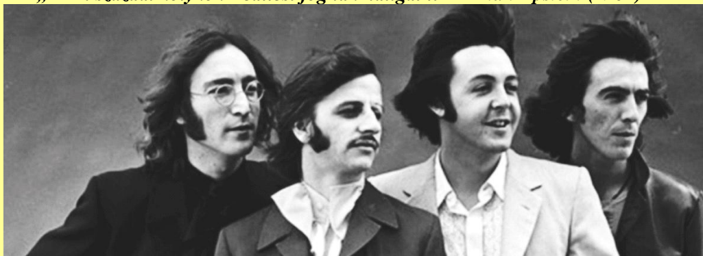
(Balról jobbra: John Lennon, Richard 'Ringo Starr' Starkey, Paul McCartney és George Harrison)

„A 21. századi kölykök Beatlest fognak hallgatni” - Brian Epstein (1964)